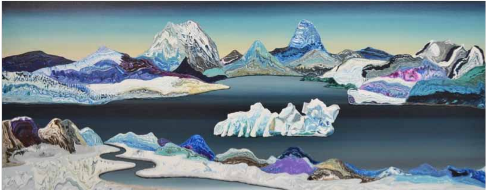
Cold River 2018 | 1.50 m x 60 cm | Acrílico sobre lienzo