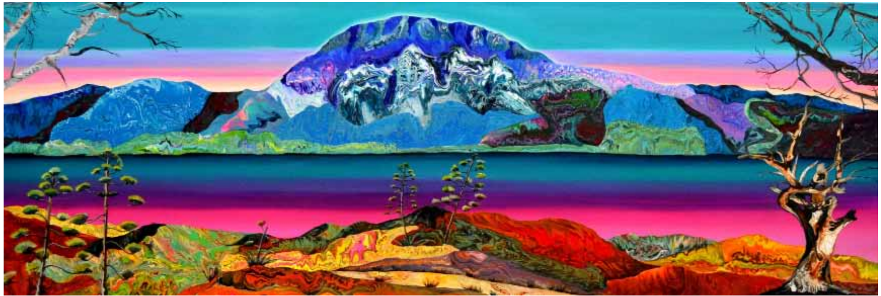
El Monte Musa 2017 | 1.50 cm x 50 cm | Acrílico sobre lienzo