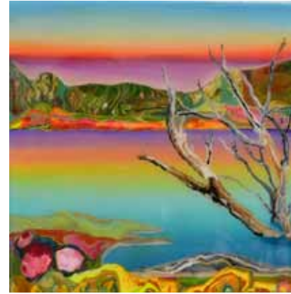
Miniaturas 2018 | 20 cm x 20 cm | Acrílico y Resina sobre lienzo