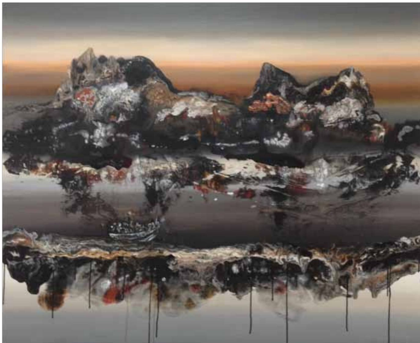
A Voyage into the Unknown 2018 | 1.50 x 1.20 m | Acrílico sobre lienzo