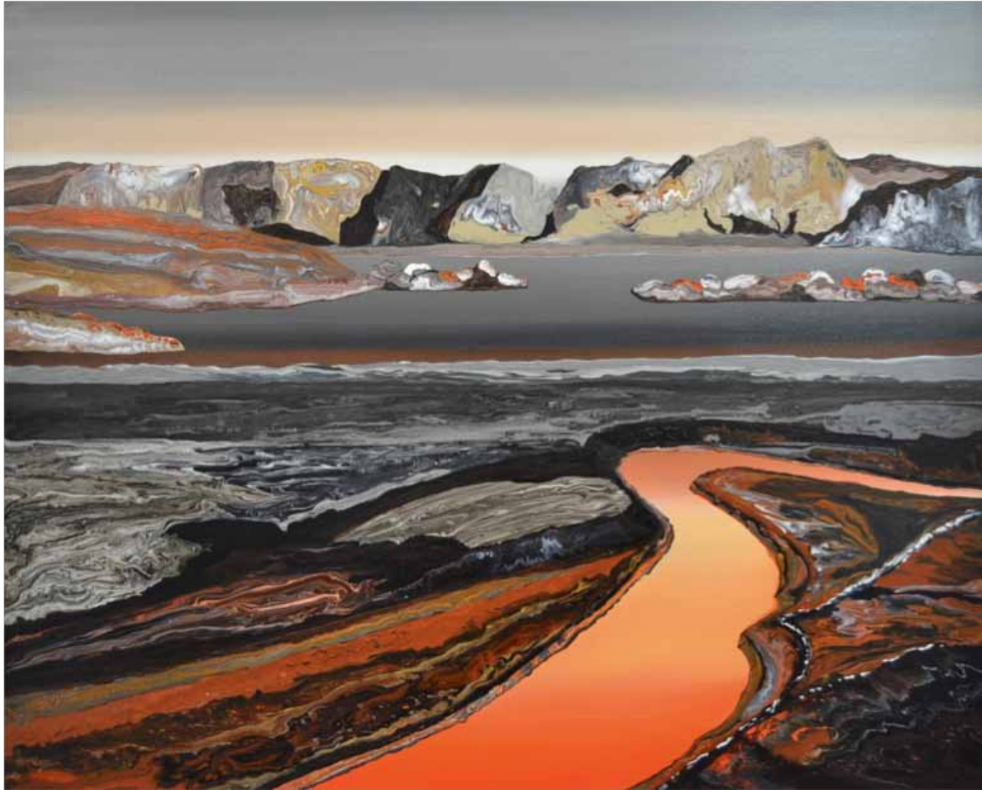
River of oil 2018 | 1.20 m x 1 m | Acrílico sobre lienzo