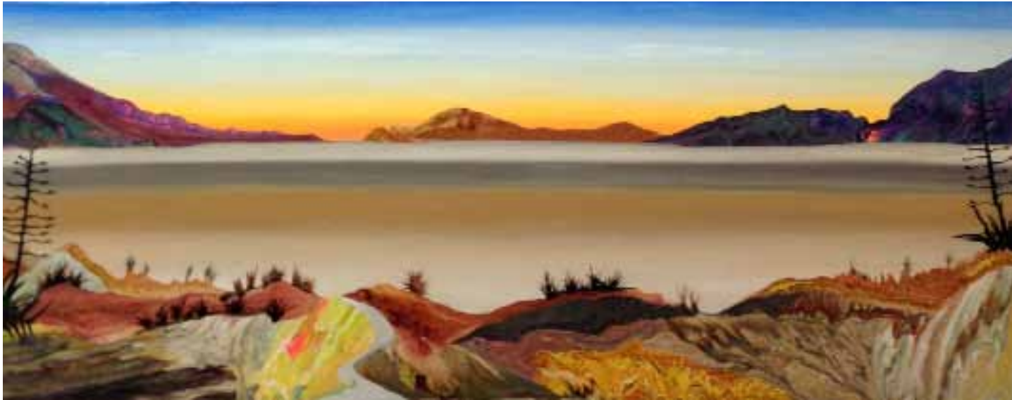
Mar en calma 2017 | 1.20 m x 40 cm | Acrílico sobre lienzo