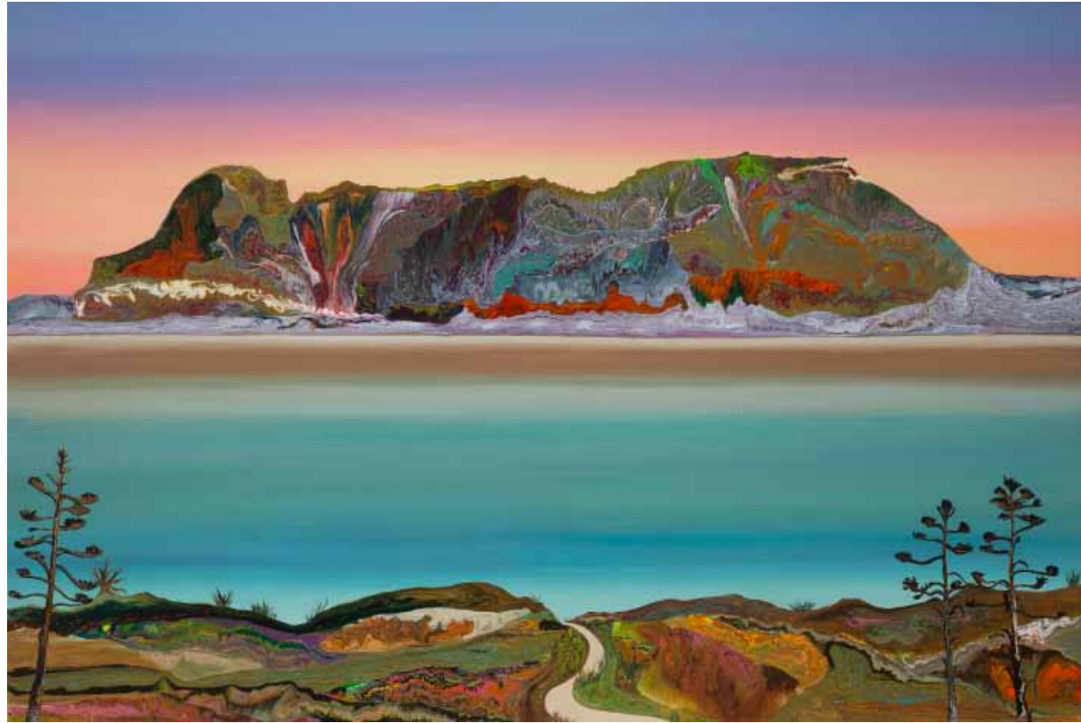
Confluencias 2017 | 1.20 m x 1 m | Acrílico sobre lienzo