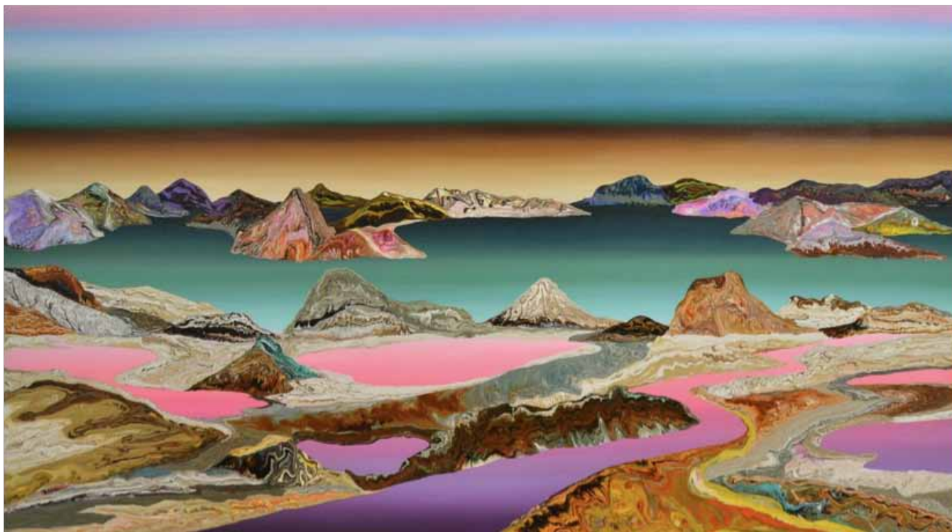
Magic River 2018 | 1.80 m x 1 m | Acrílico sobre lienzo